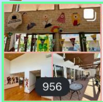
「みんなむすんでマルシェ」 けやきの家 (in miraie)